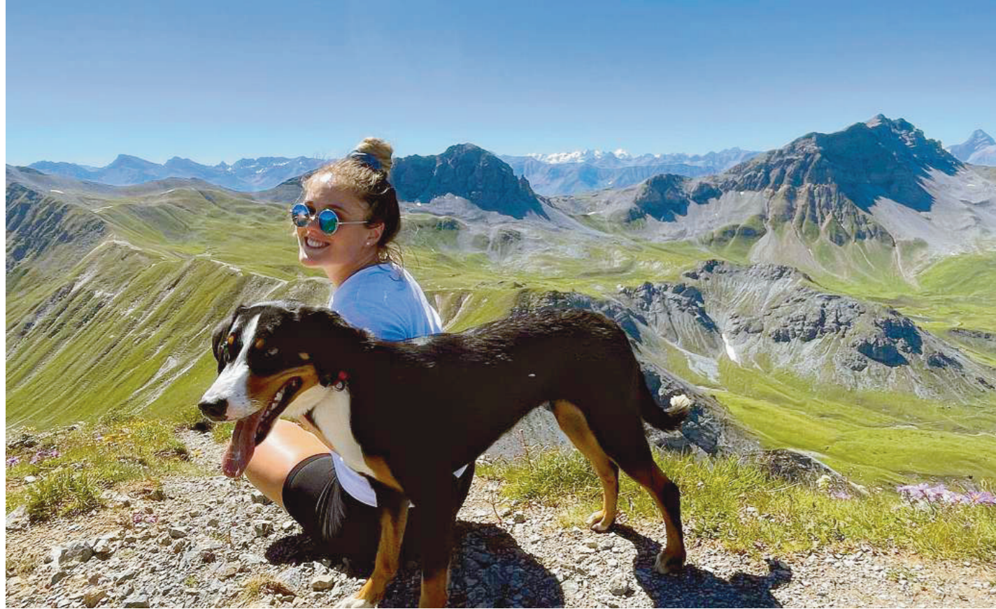
Mit dem Hund zum Training in den Bergen unterwegs.